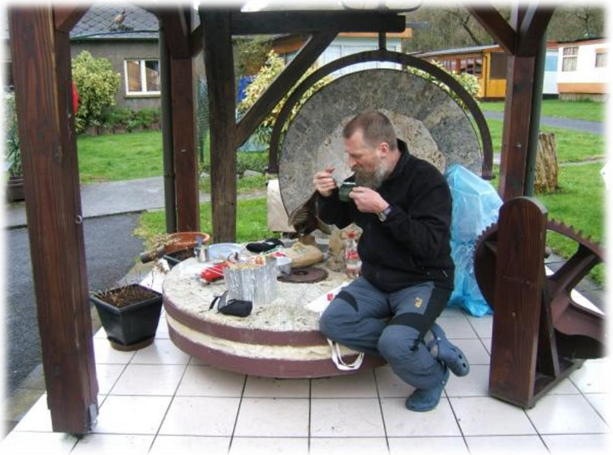
De molensteen op de camping wordt door ons gebruikt als tafel