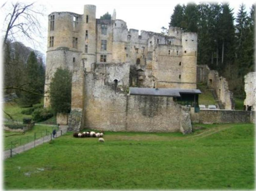
De burcht van Beaufort