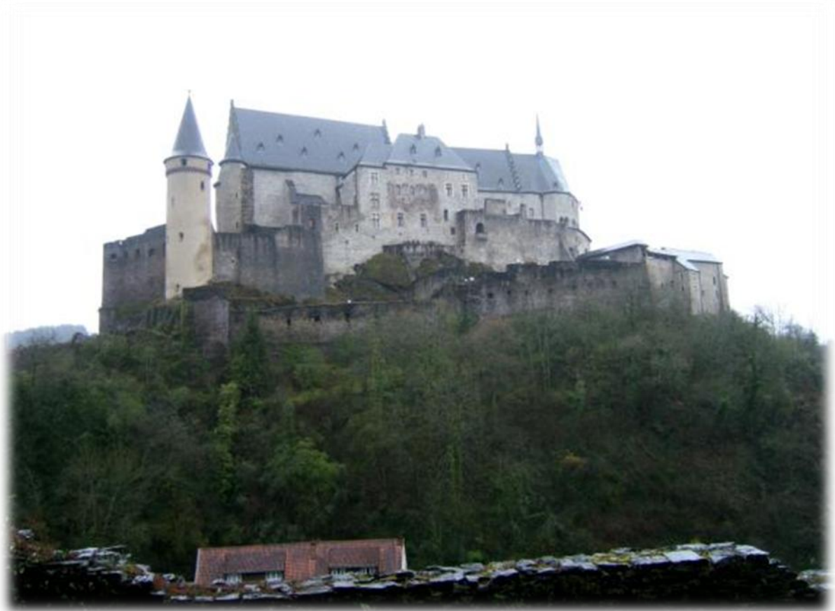
De burcht van Vianden