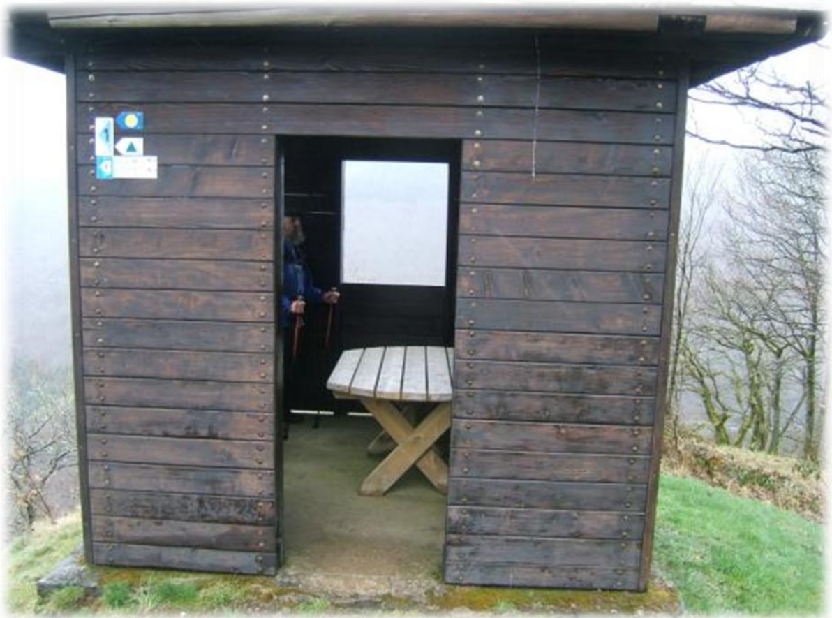
Eventjes verpozen in een schuilhut