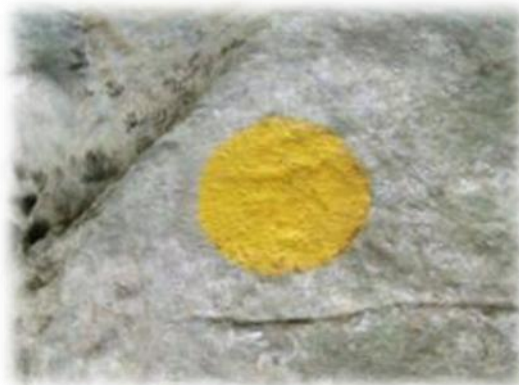
In Luxemburg wordt het GR-teken vervangen door een gele bol