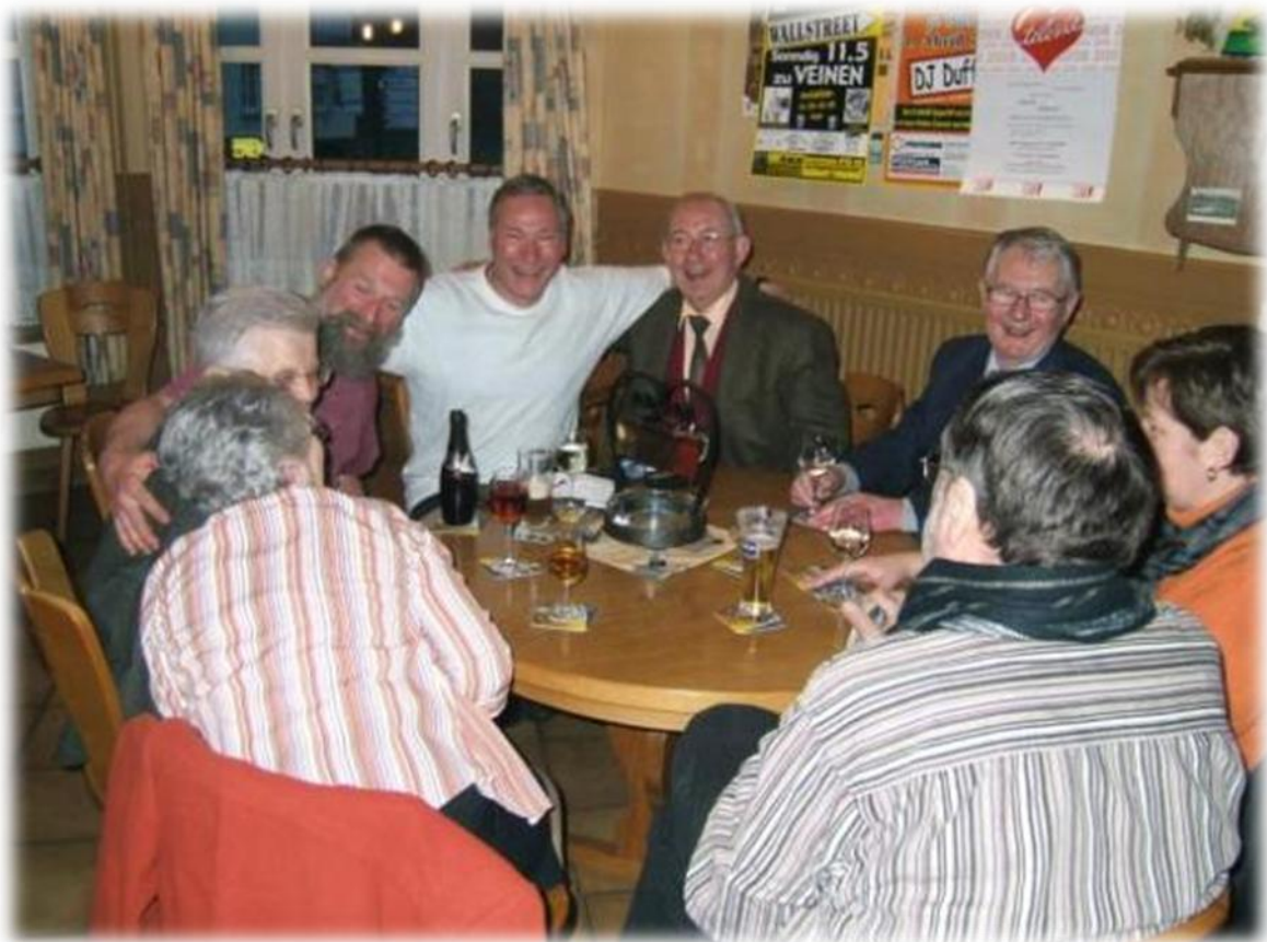
Gezellig tussen onze Luxemburgse vrienden