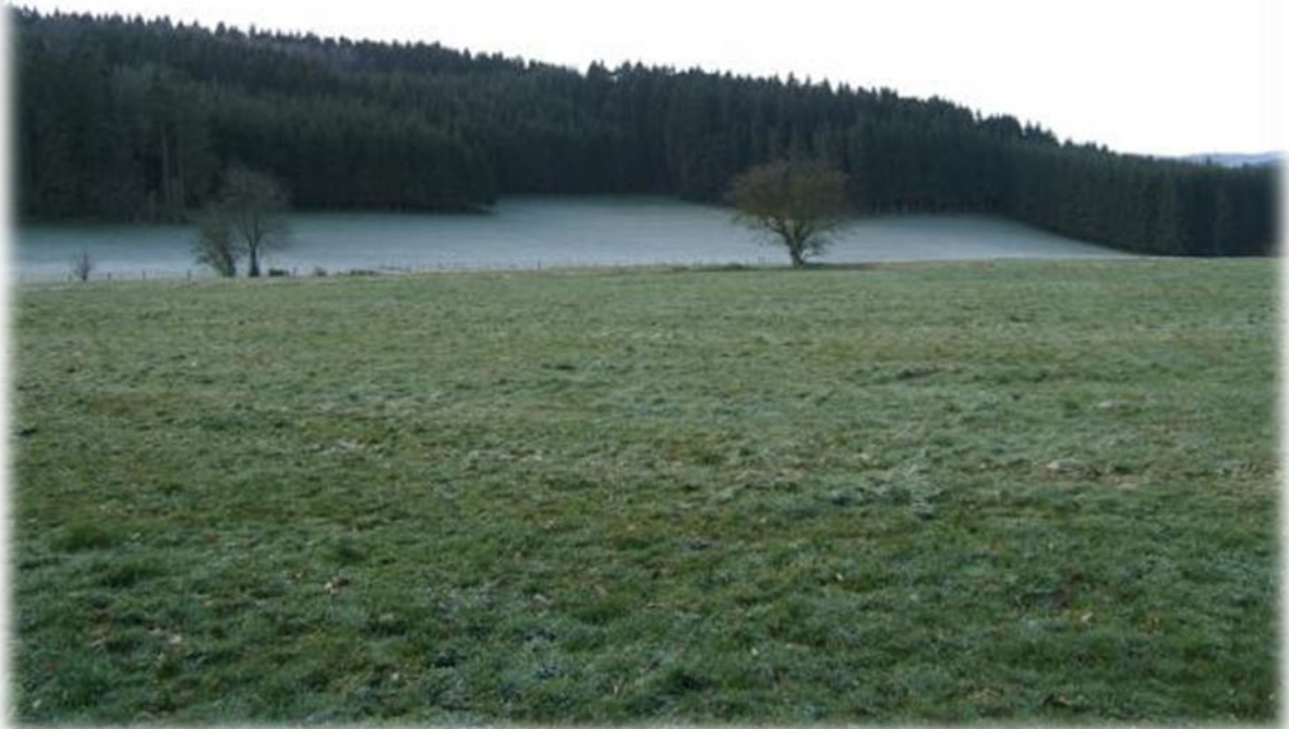
De vorst heeft afgelopen nacht zijn werk gedaan