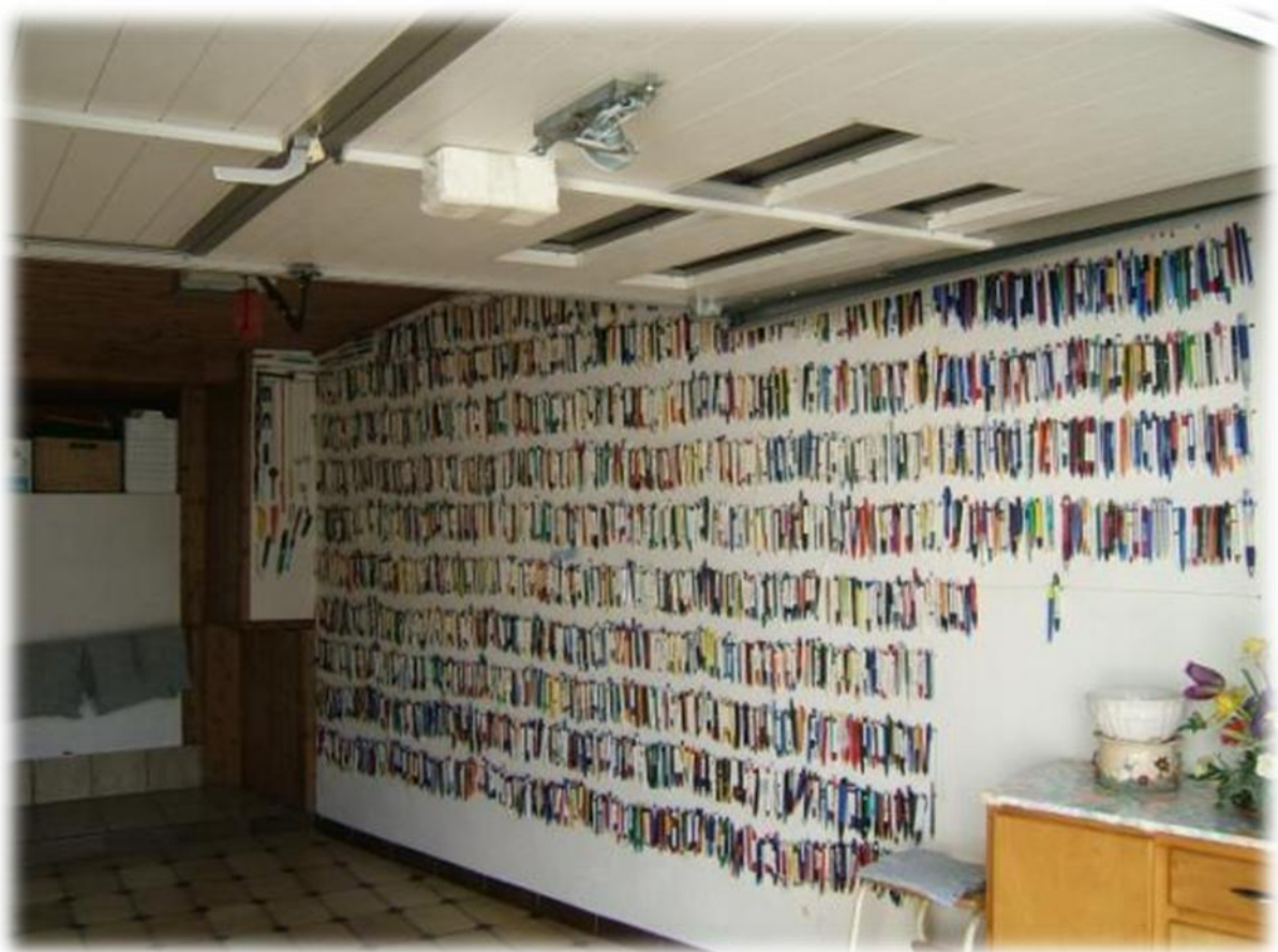
Een verzamelaar van stylo's