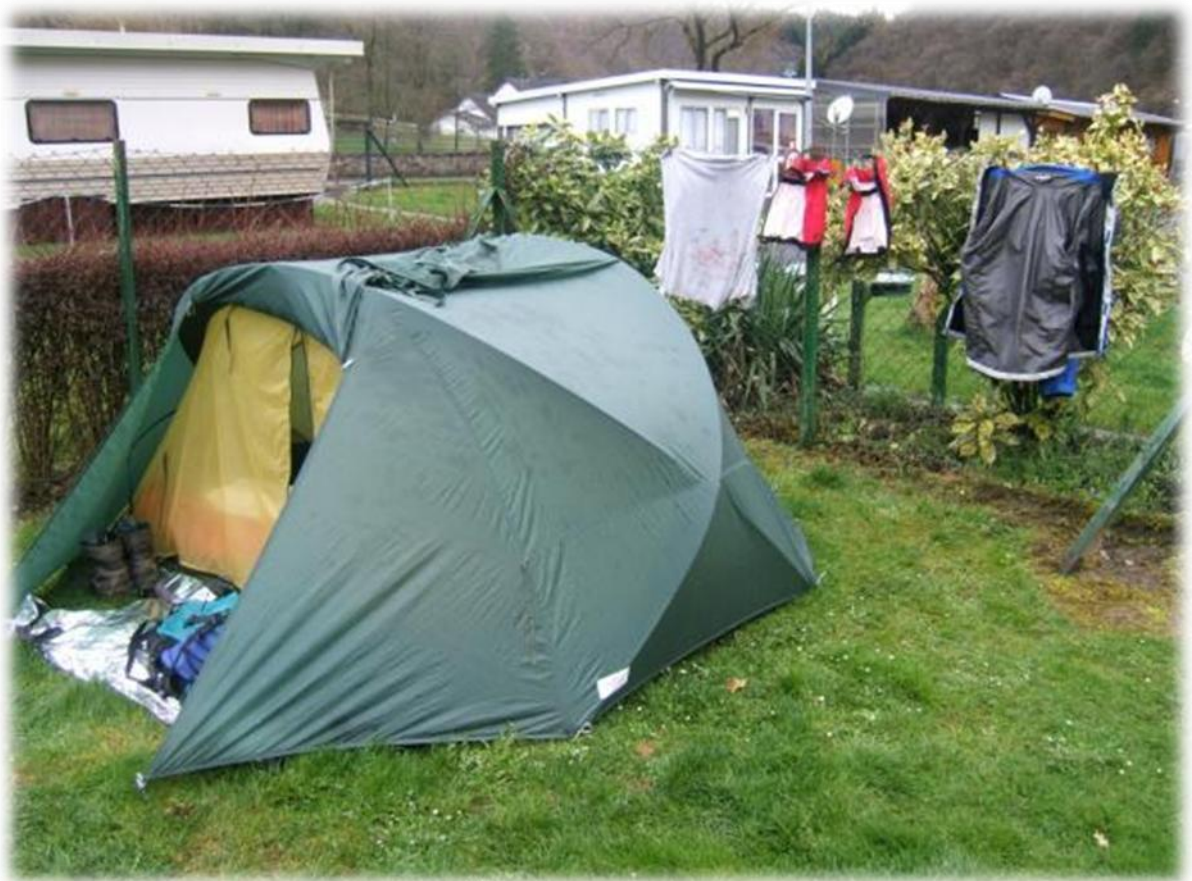
We zijn terug de enige tentgasten op de camping.