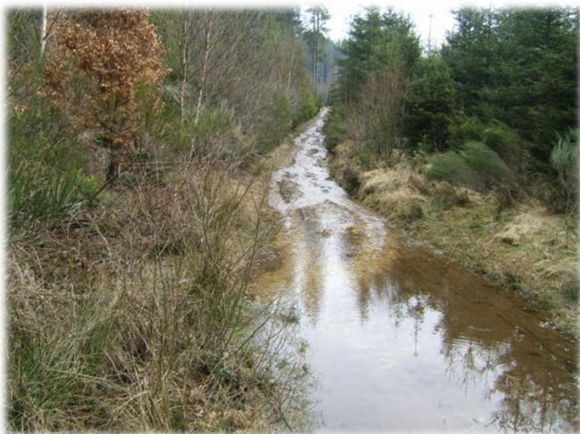
Door de regen van de afgelopen dagen liggen sommige paden er nogal vochtig bij