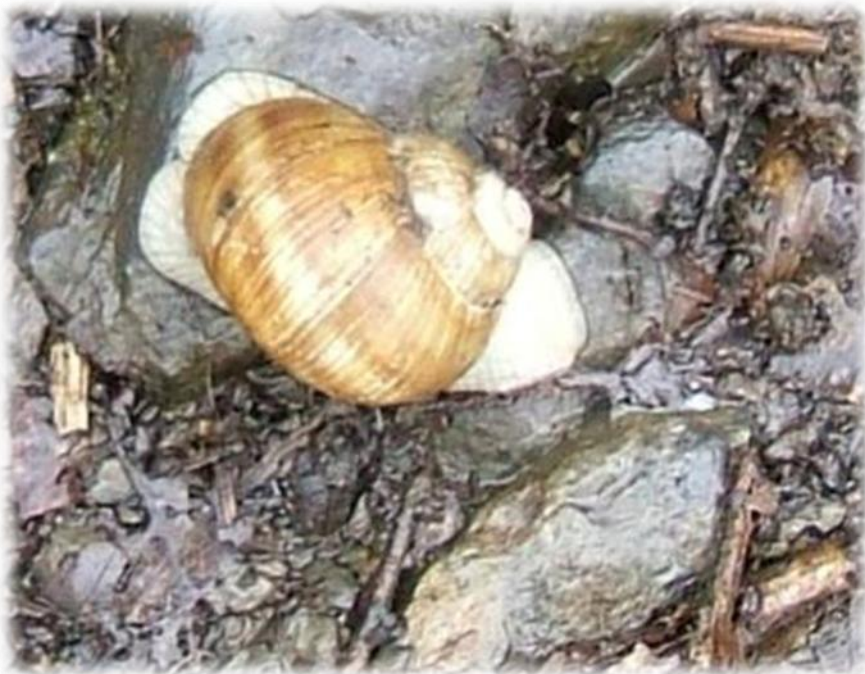
Slak met rugzak