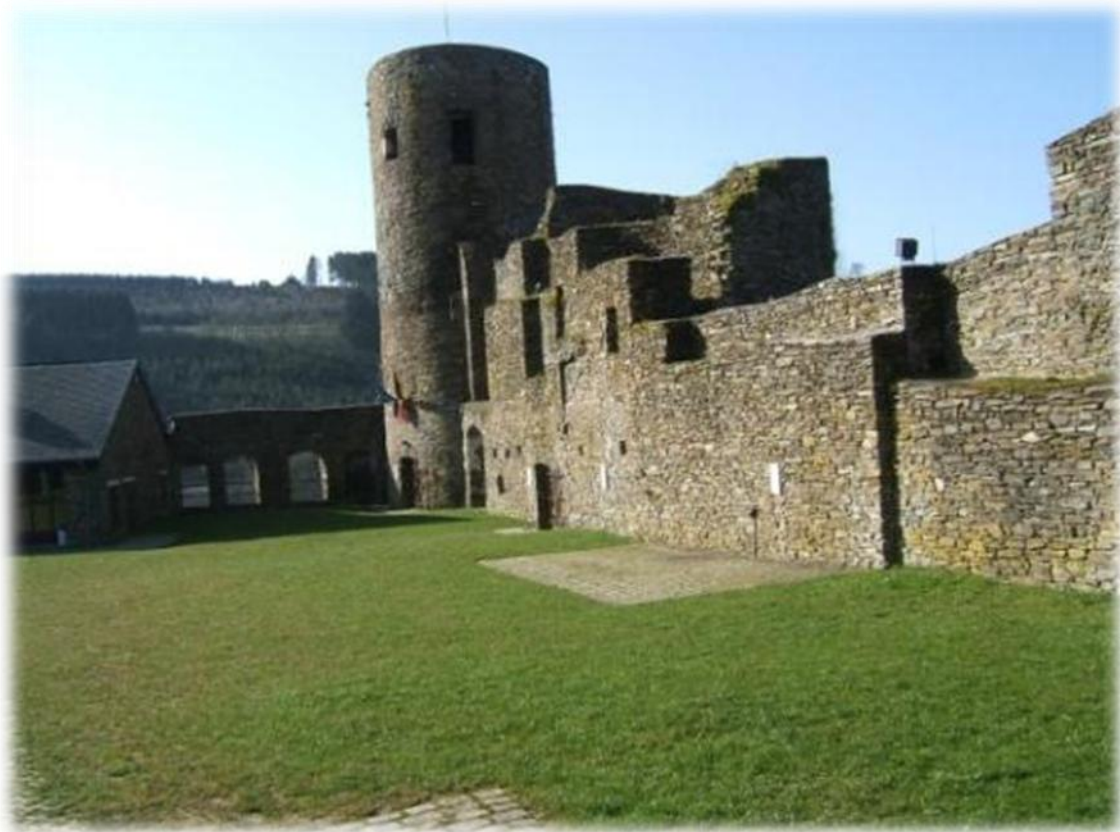
De overblijfselen van het kasteel van Burg-Reuland