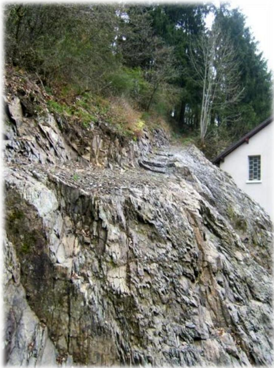
Bovenop deze rotswand loopt de GR5