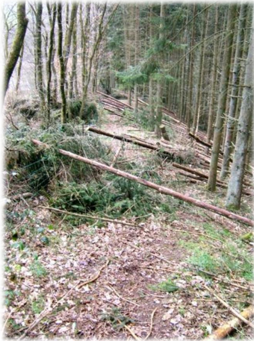
Ons wandelpad is bezaaid met hindernissen