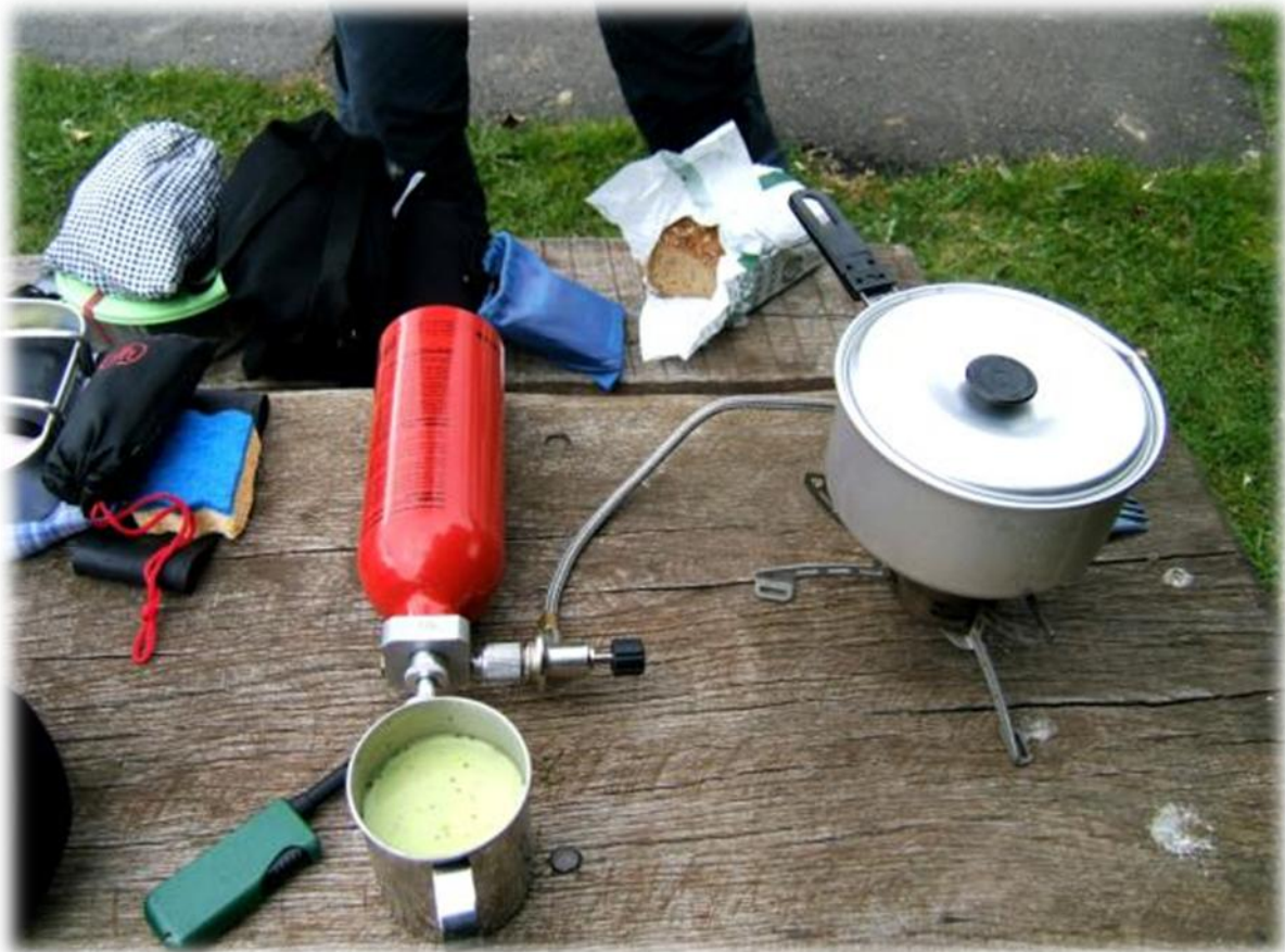
Staf, alias “de kok” is aan het koken op benzine