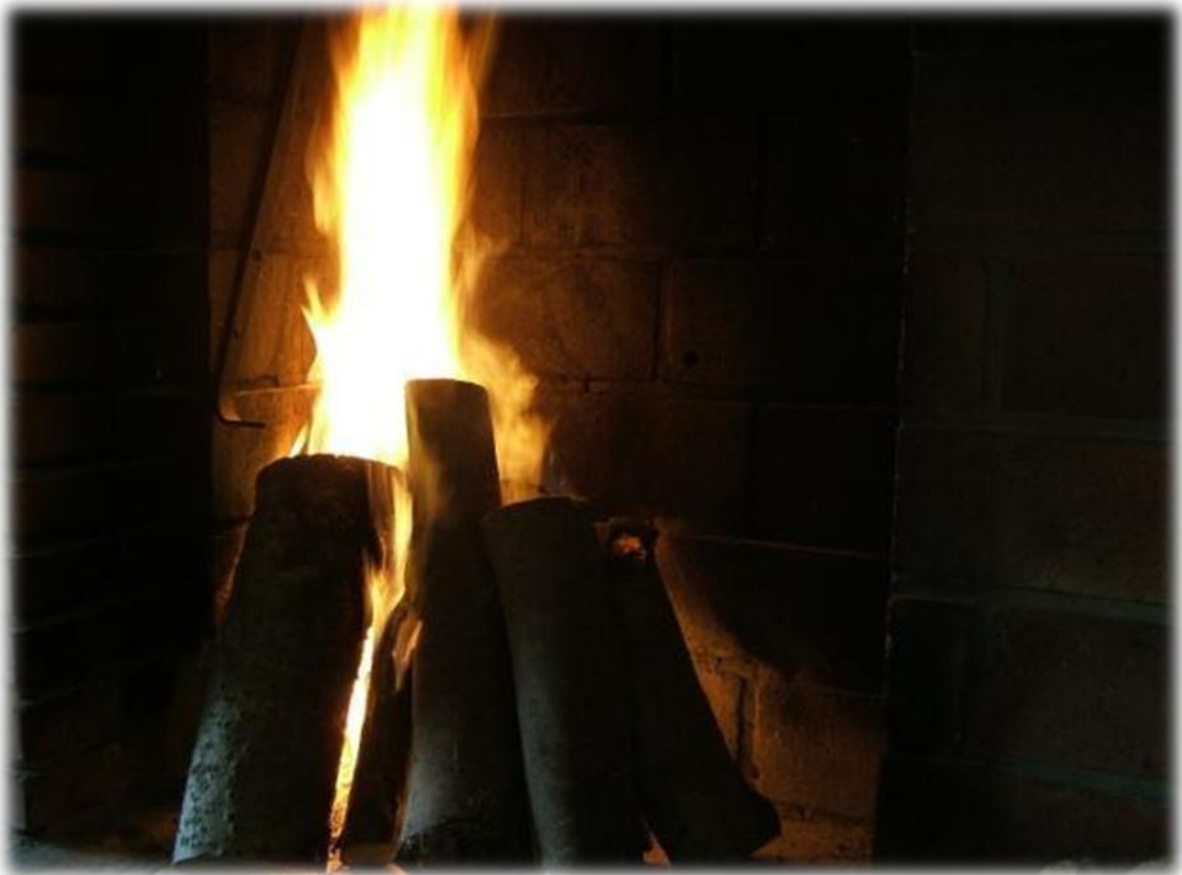
Op het ogenblik dat we in de cafetaria van de camping komen zijn we de enige gasten. Staf, alias “de pyromaan” steekt meteen de open haard aan.