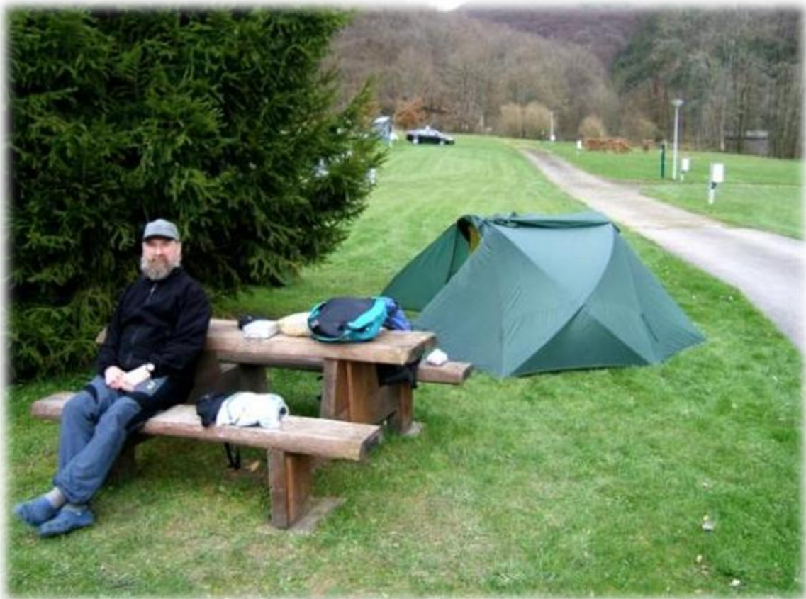
We bevinden ons op de camping in Tintesmilen aan de oever van de Our