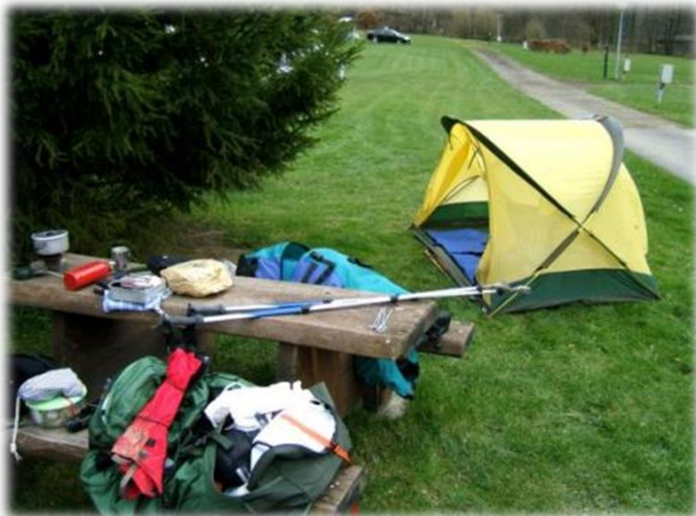
De binnentent staat er al. De buitentent moet er nog op. De tent heeft twee in- en uitgangen