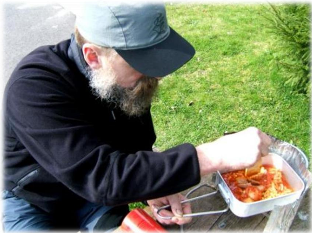
Deegwaren en gehaktballen in tomatensaus, meer moet dat niet zijn.