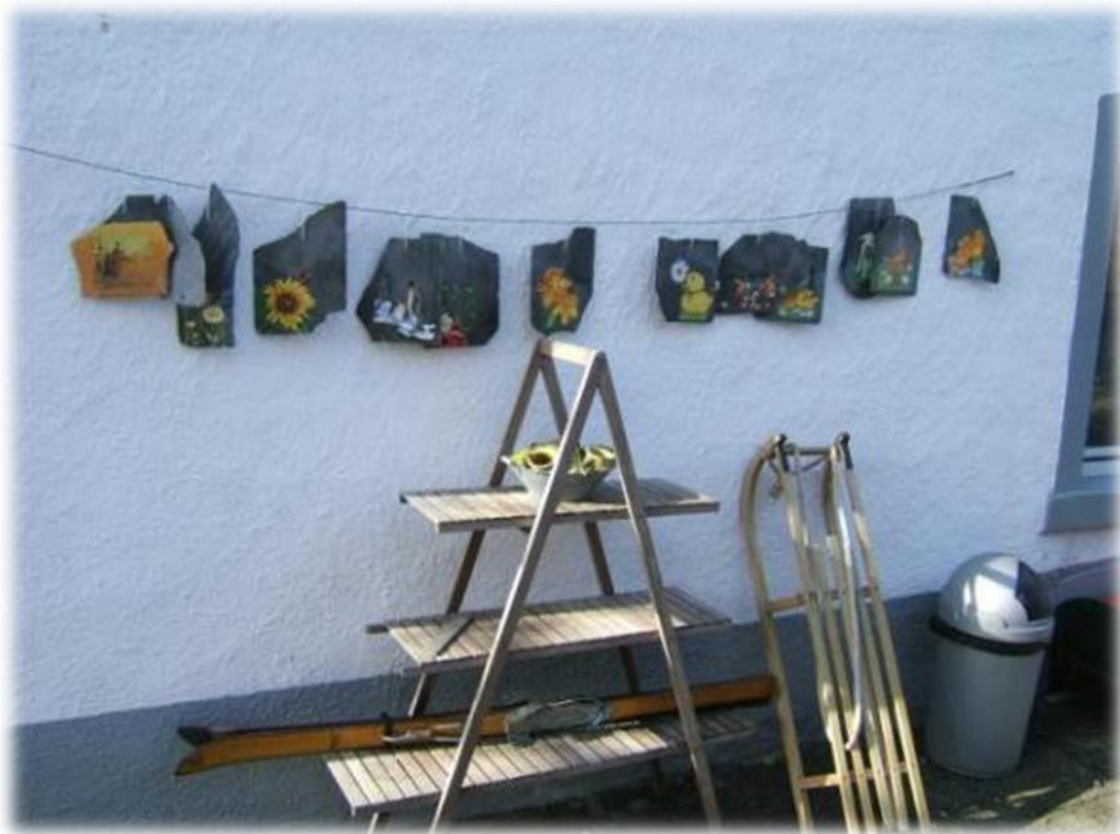
De plaatselijke dorpskunstenaar