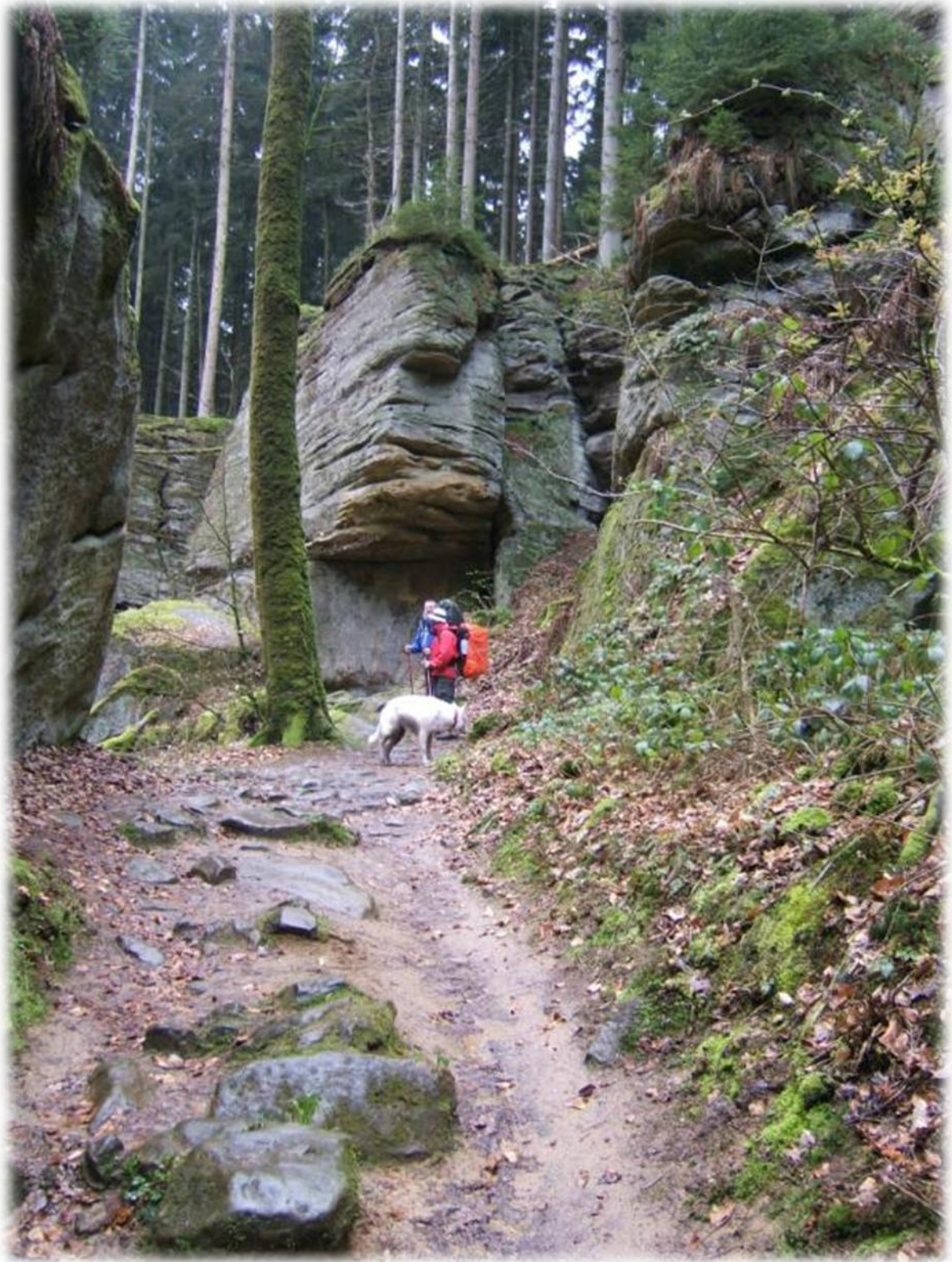
Soms wanen we ons in een sprookjeswereld