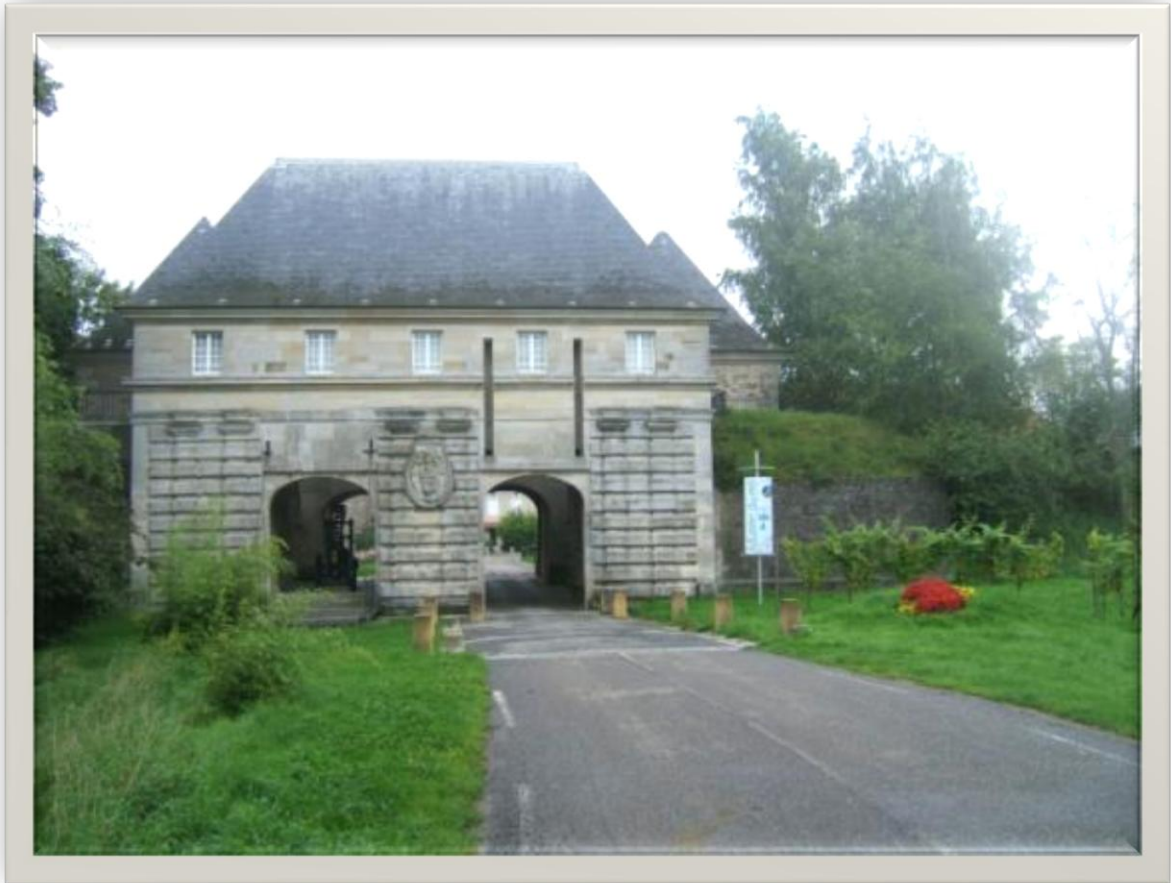
Porte de France in Marsal