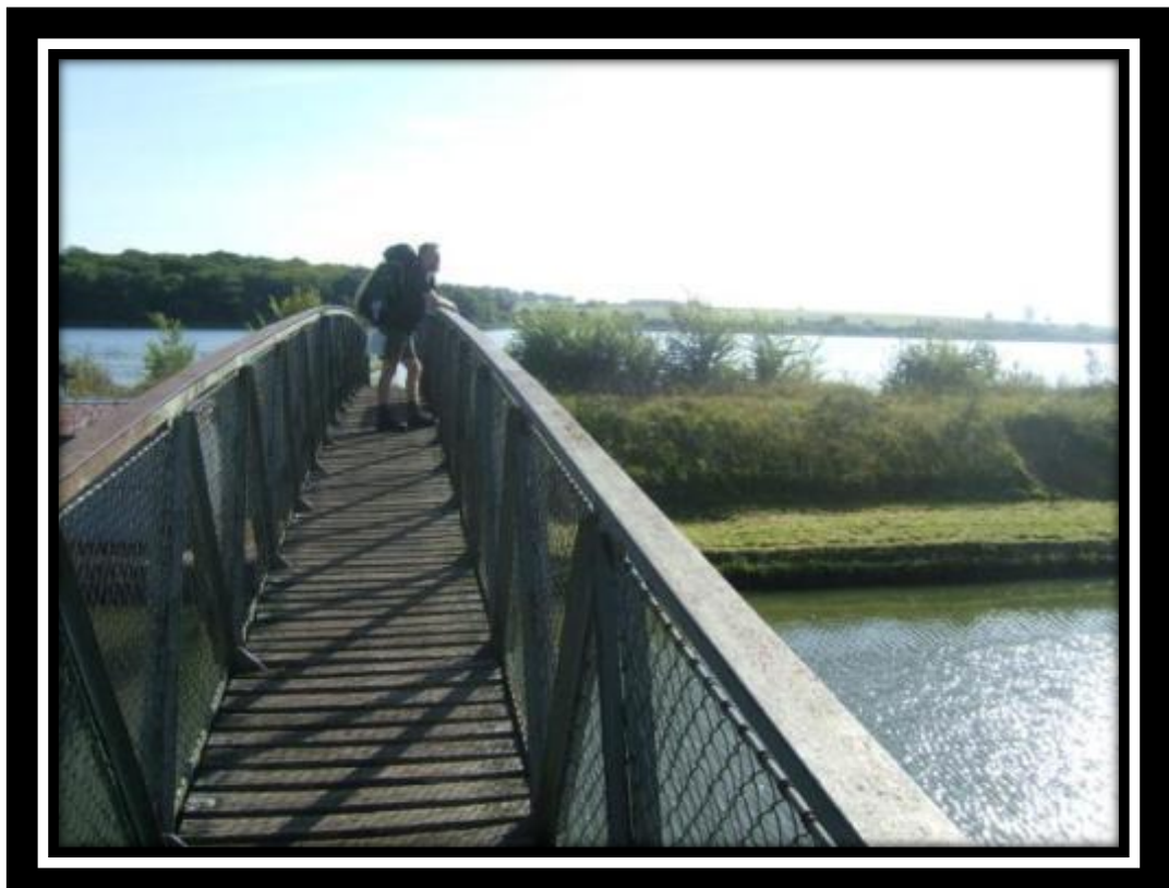
Staf genietend van het uitzicht