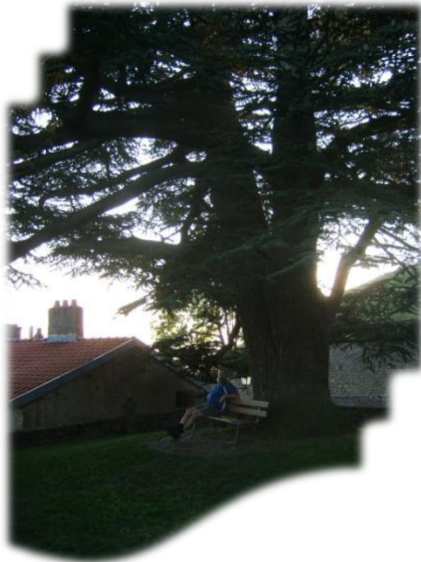
Staf rust wat uit en geniet van het mooie uitzicht van onder de kerkeboom.