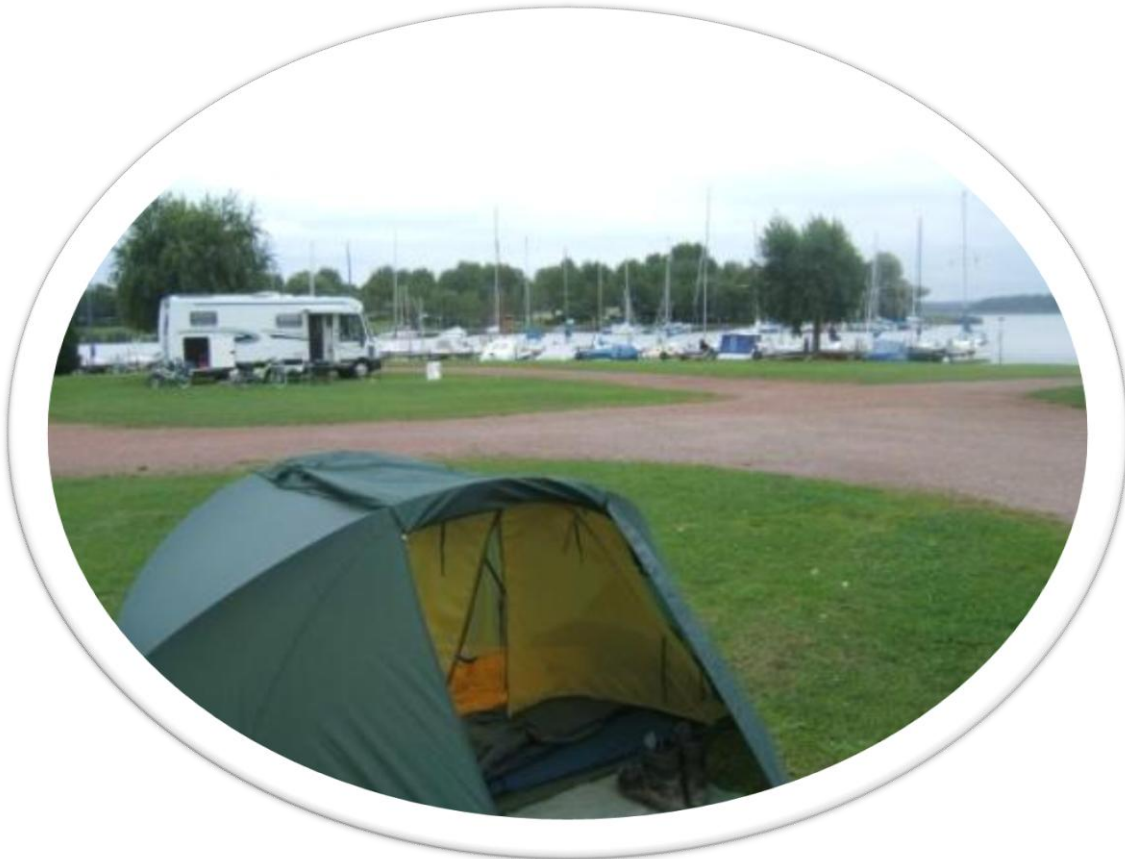
De mooie camping aan de haven in Rhodes