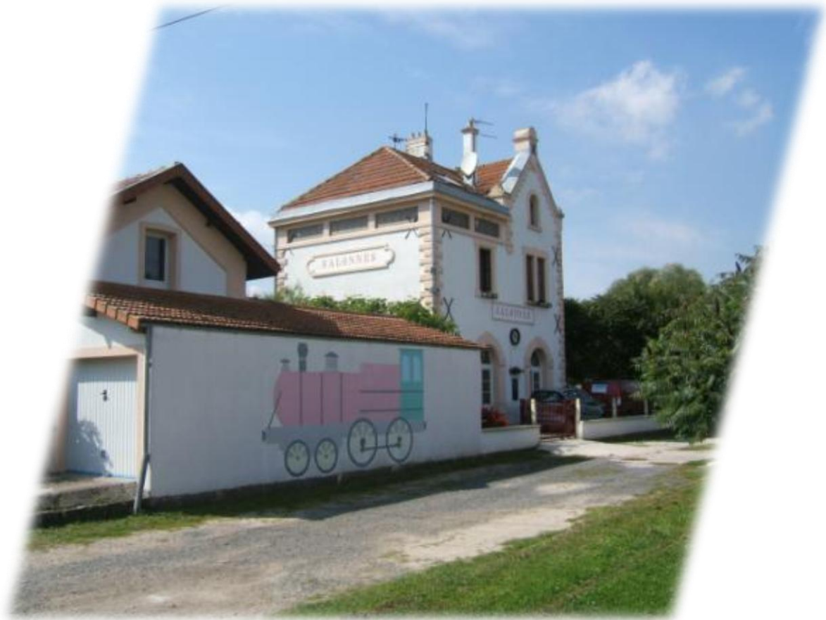
Het vroegere treinstationnetje heeft nog niets aan charme ingebonden