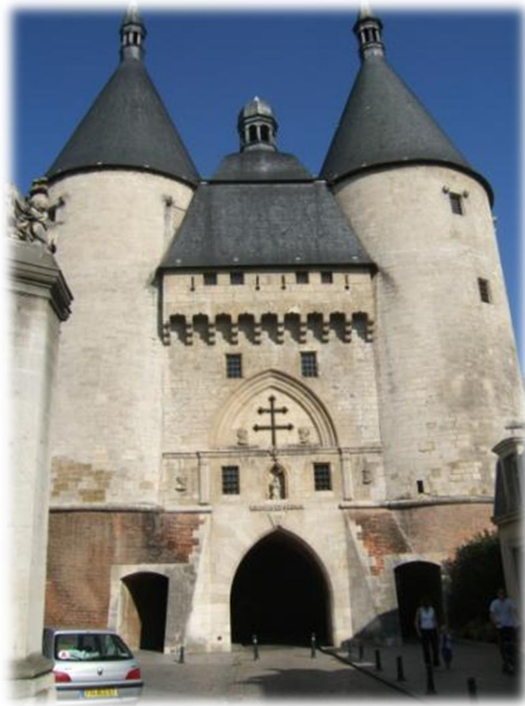
Porte de la Craffe