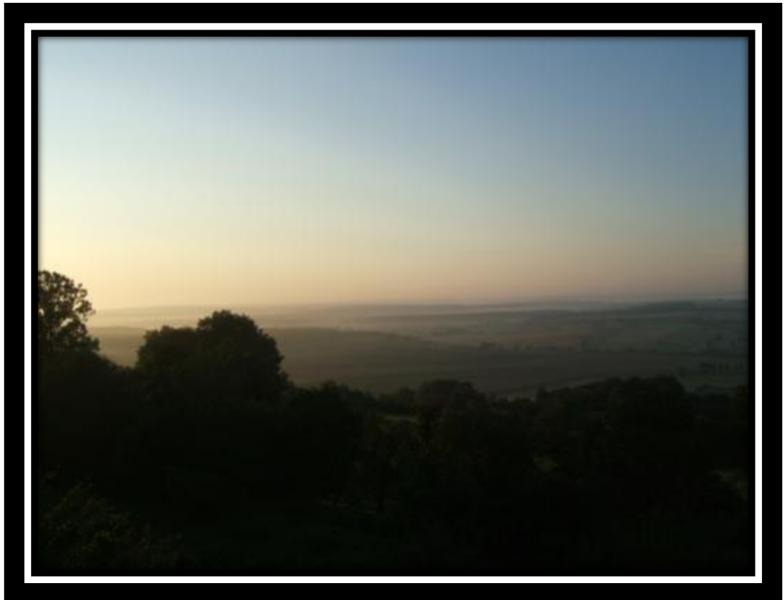
Zonsopgang gezien van aan ons tentje.