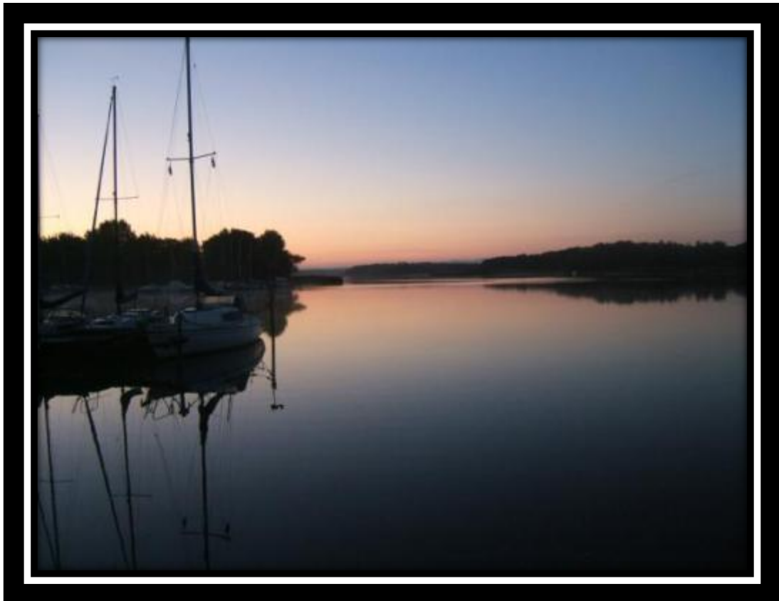
Zonsondergang (boven) en zonsopgang (onder) in Rhodes