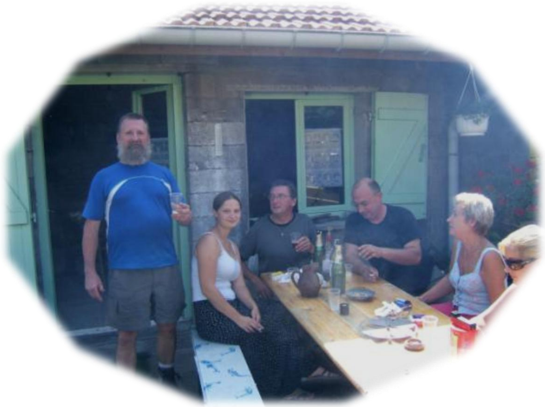
Het karafje water staat tussen de medicijnflessen.....