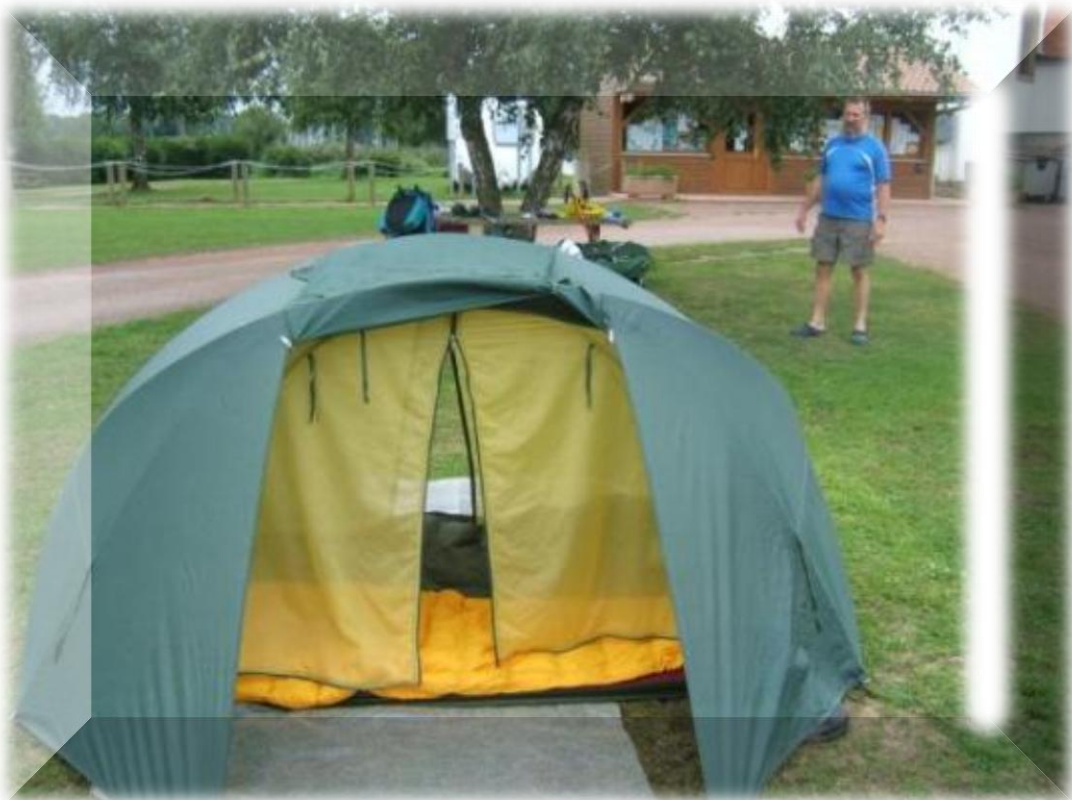
Staf controleert of het tentje wel vlak genoeg staat