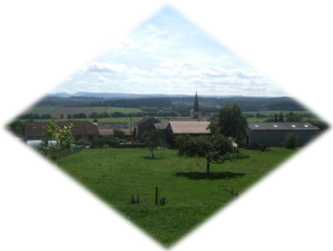
De Vogezen komen dicht(er) en dicht(er)