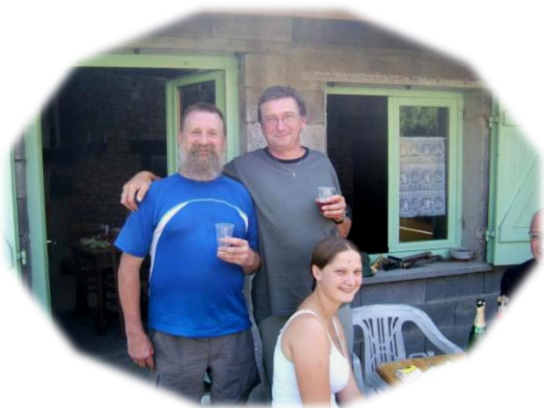
Onze lege waterzakken liggen op het venstertablet.....