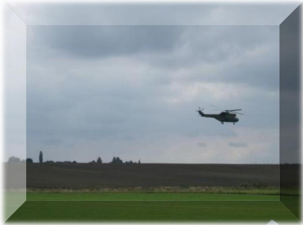
Een legerhelicopter landt zowaar op een boogscheut van ons