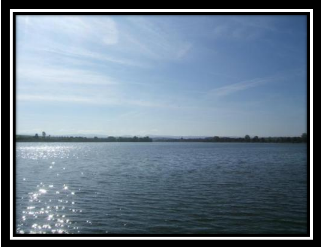
Als je goed kijkt zie je op de achtergrond al de contouren van de Vogezen