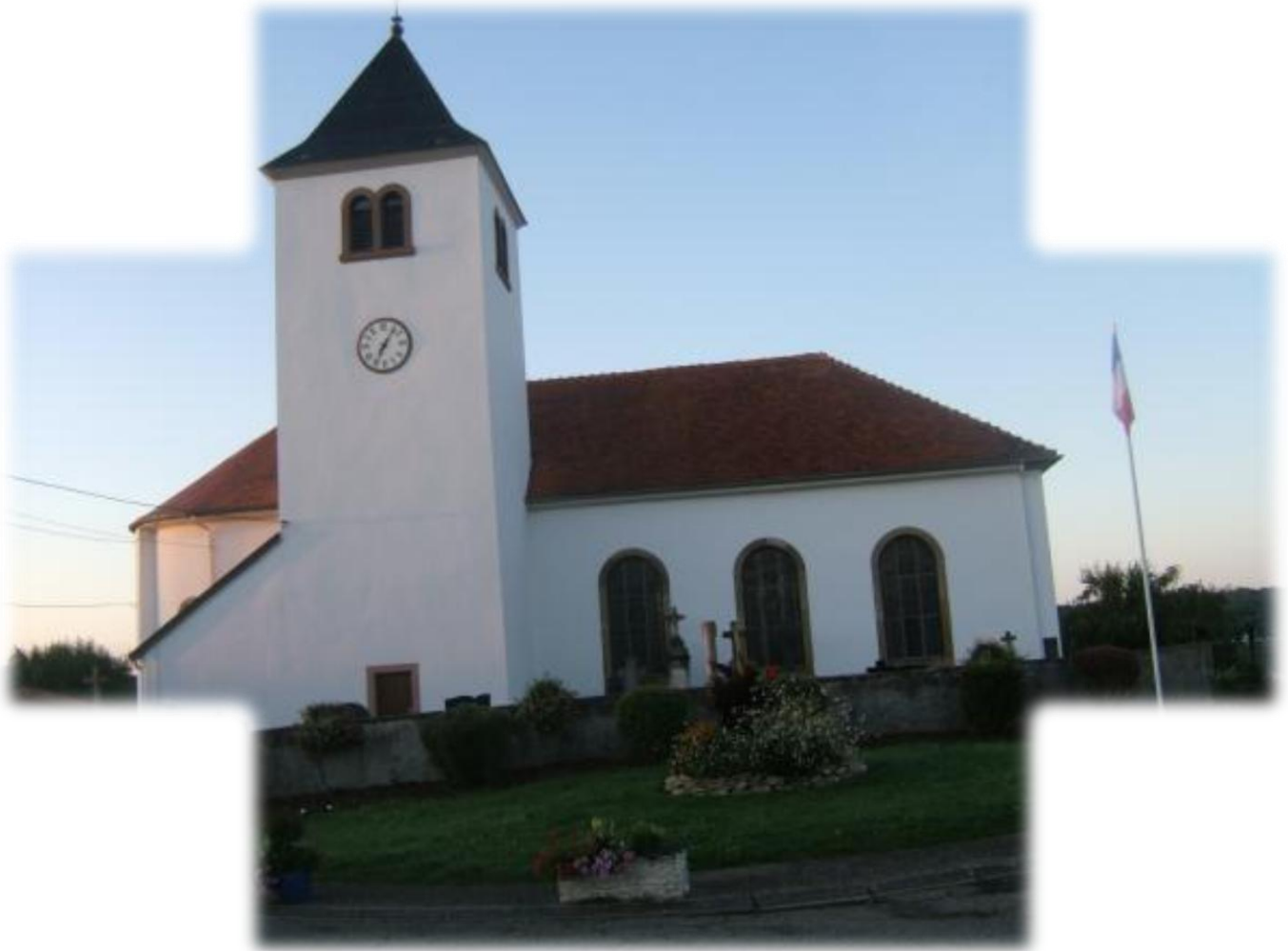
Kerk in Rhodes bij ons vertrek

Vertrek om 07.00 uur – aankomst omstreeks 16.00 uur. Van Rhodes tot Saint-Quirin 32 km. Gemiddelde snelheid in beweging : 5,2 km.