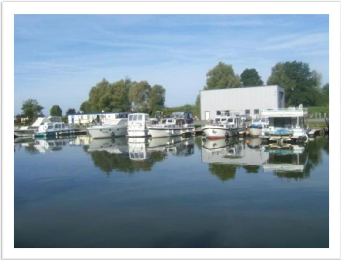
Enkele boten op het Canal des Houillères de Sarre