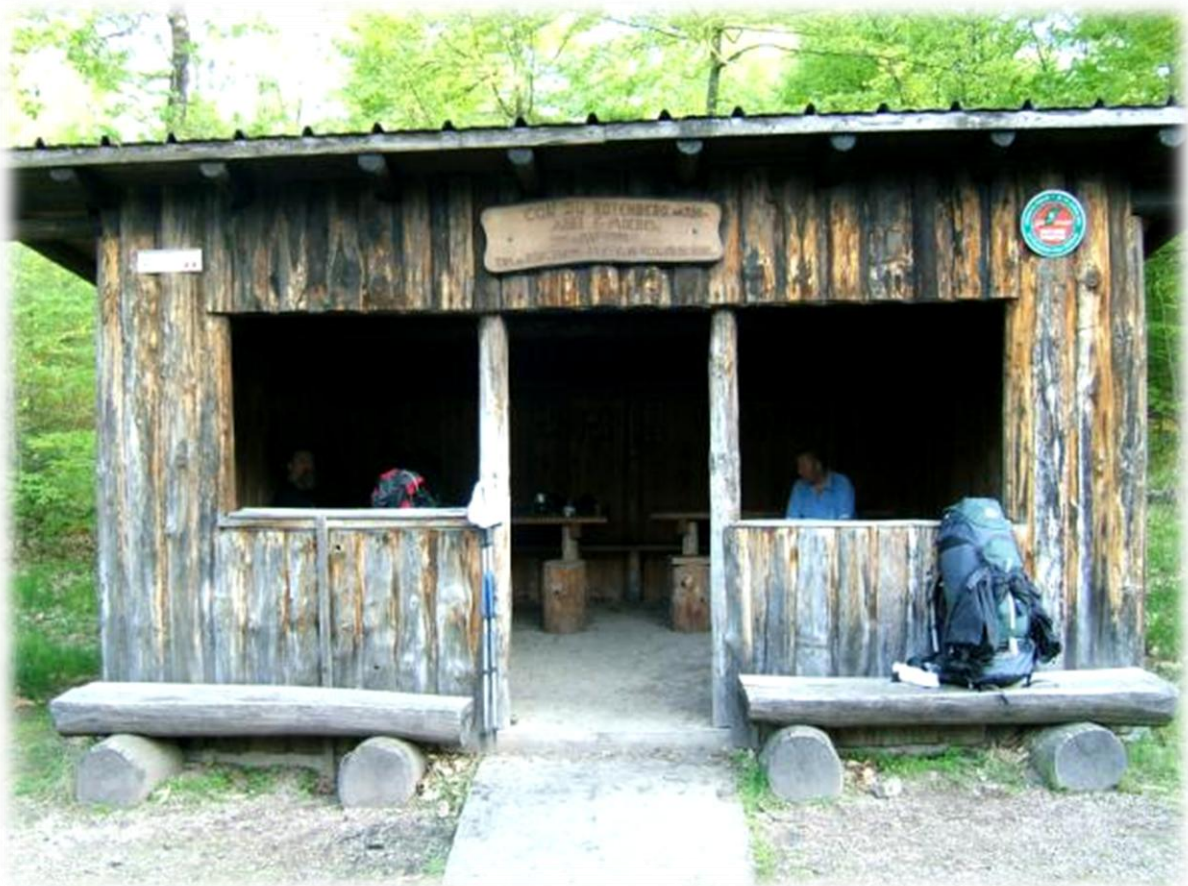
Na een tweetal uurtjes stappen nemen we ons ontbijt in een abri in de bossen