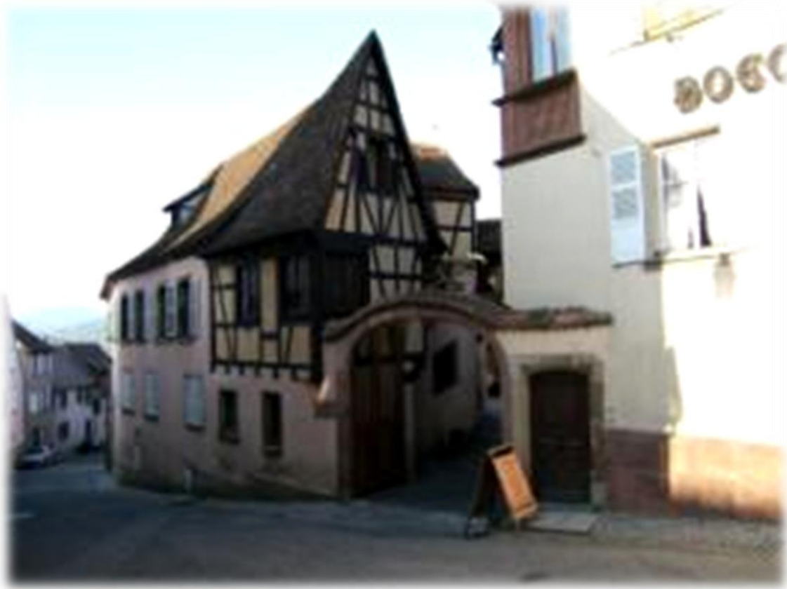
We stappen door feërieke dorpjes en smalle steegjes, bergop en bergaf.