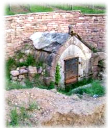
Een oude bakoven (?) opgegraven in een wijngaard