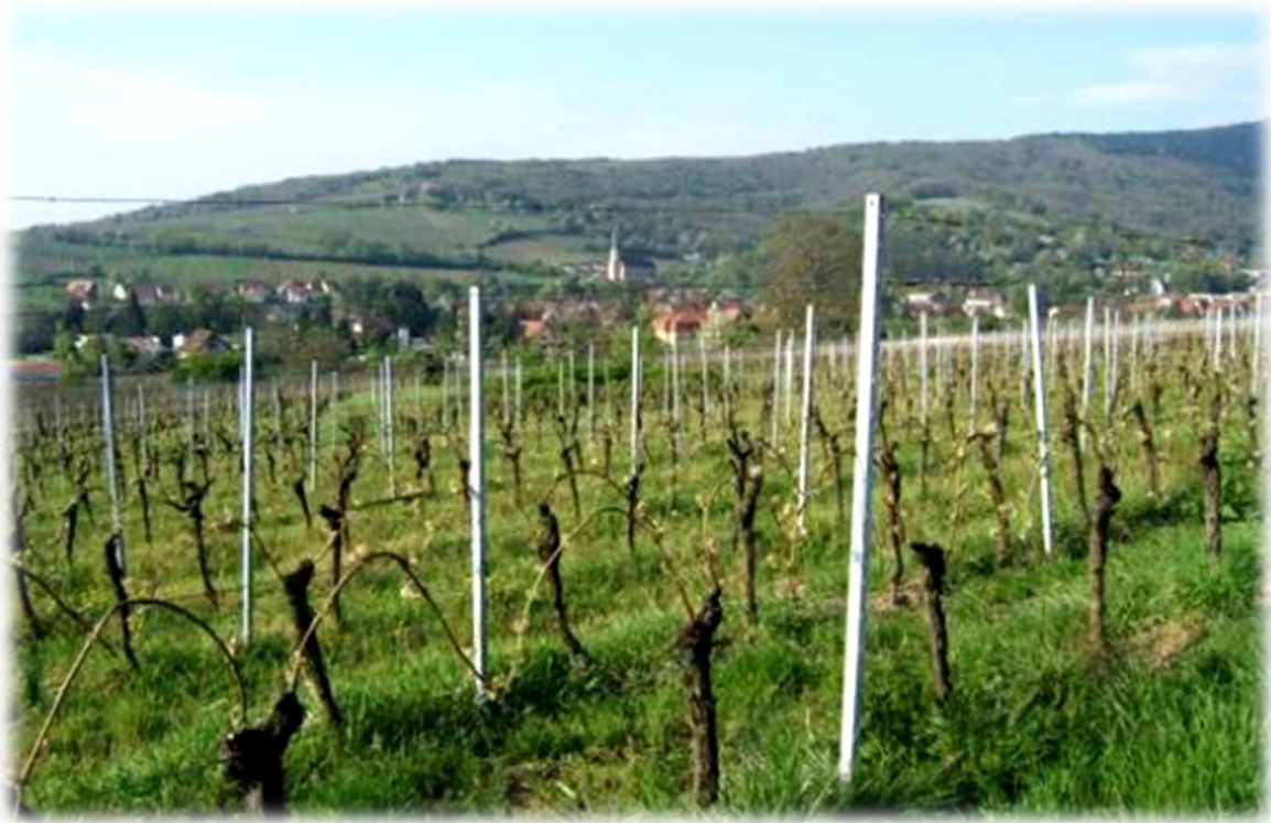
Tussen de dorpjes door lopen we door wijngaarden met weidse vergezichten, uiteraard ook bergop en bergaf.