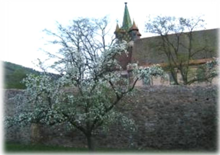
De achterkant van de kerk van Châteinois