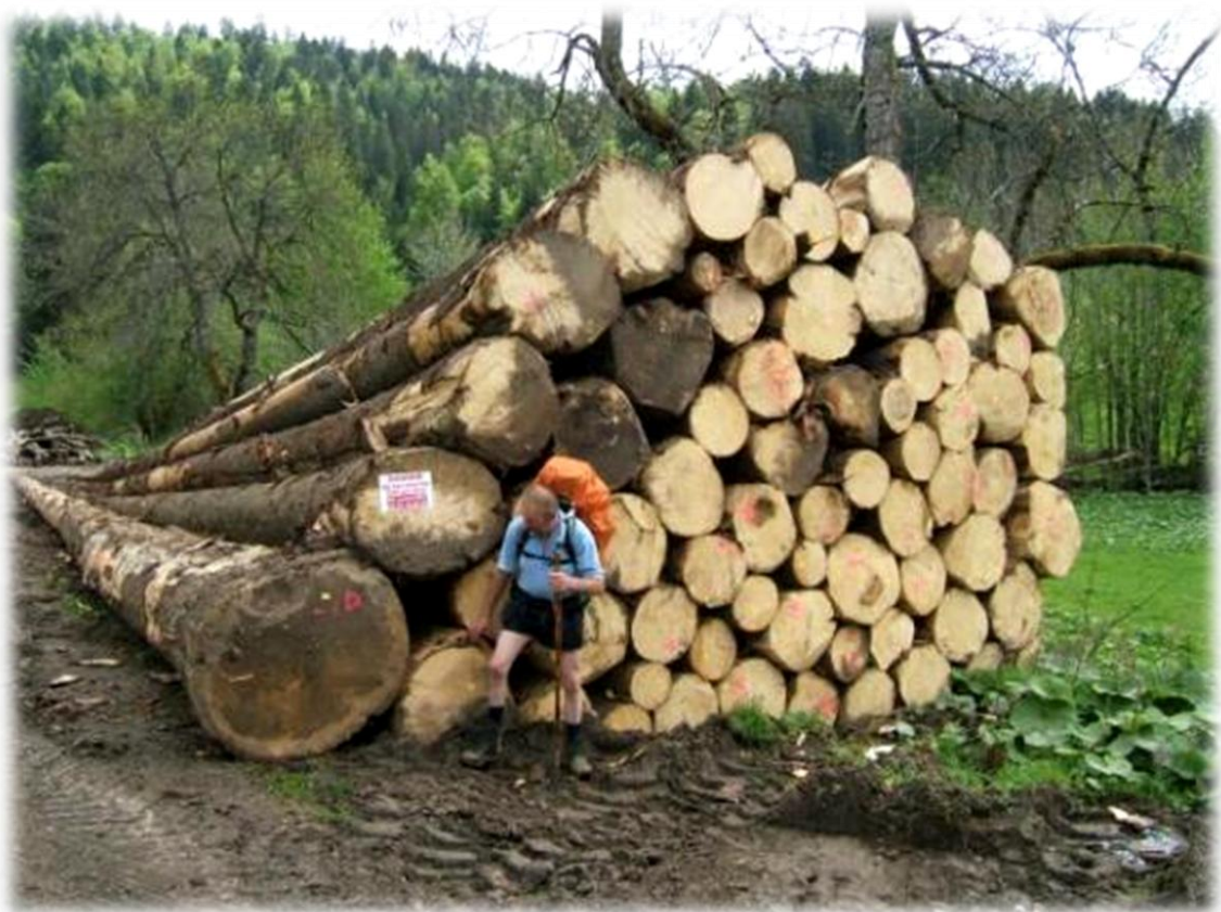
Fier pauzeert Henk voor een stapel, flink uit de kluiten gewassen, boomstammen.