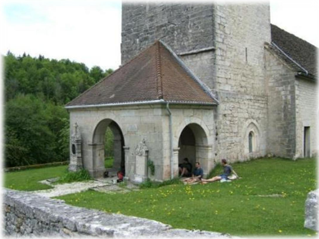
Nog drie GR5trekkers. We zullen ze later nog ontmoeten.