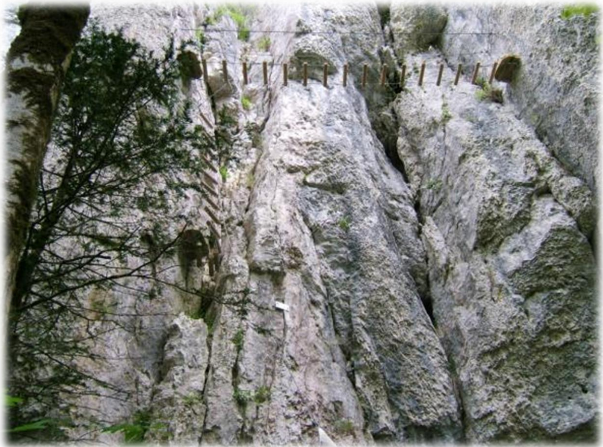
Dit is het begin van een klettersteig maar dit is niet voor ons bedoeld.