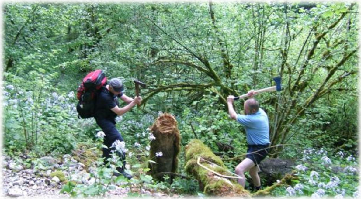
Met vereende krachten wordt er een boompje omgehakt.