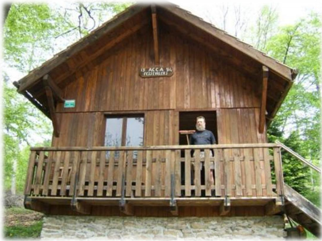
We komen aan een onbemande hut waar we ons middagmaal nuttigen. De huttenwirt van dienst heeft zojuist alles schoon gemaakt.