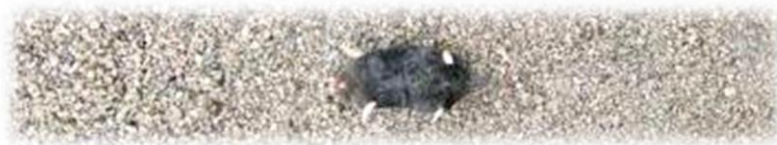
Een mol die de geest gegeven heeft