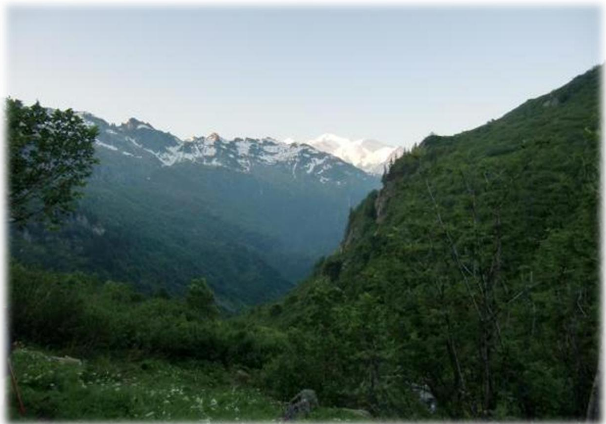
De witte berg op de achtergrond is de Mont Blanc, de hoogste berg van de Alpen.