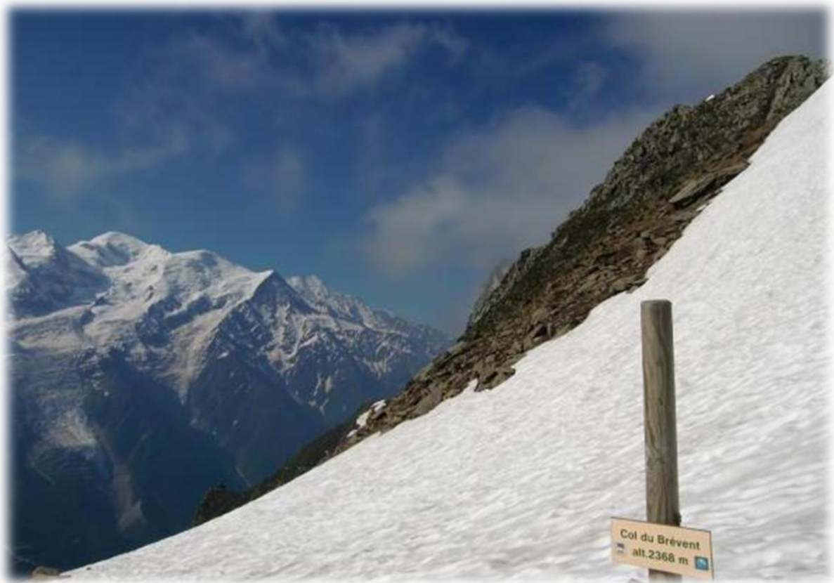
Col du Brevent met zicht op Mont Blanc.