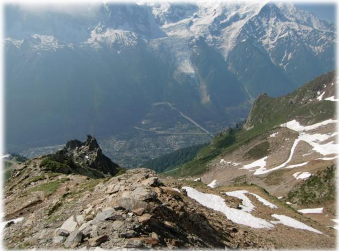
Meer dan duizend meter dalen en we zijn in Chamonix, het einde van deze tiendaagse trekking.