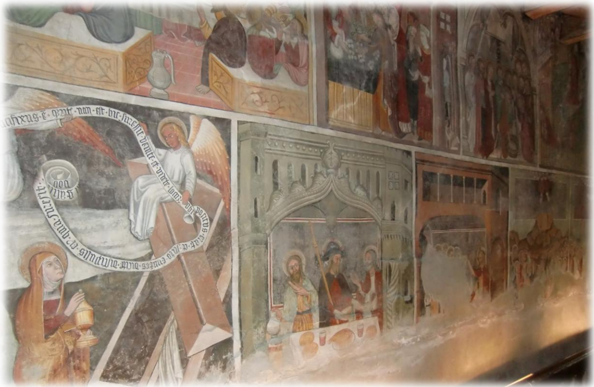
De oude kapel St-Antonie in Bessons dateert uit de vijftiende eeuw. Alle muren zijn beschilderd. De beschildering gaat over het leven van Christus en over de Geboortekerk op de Pinksterdag.