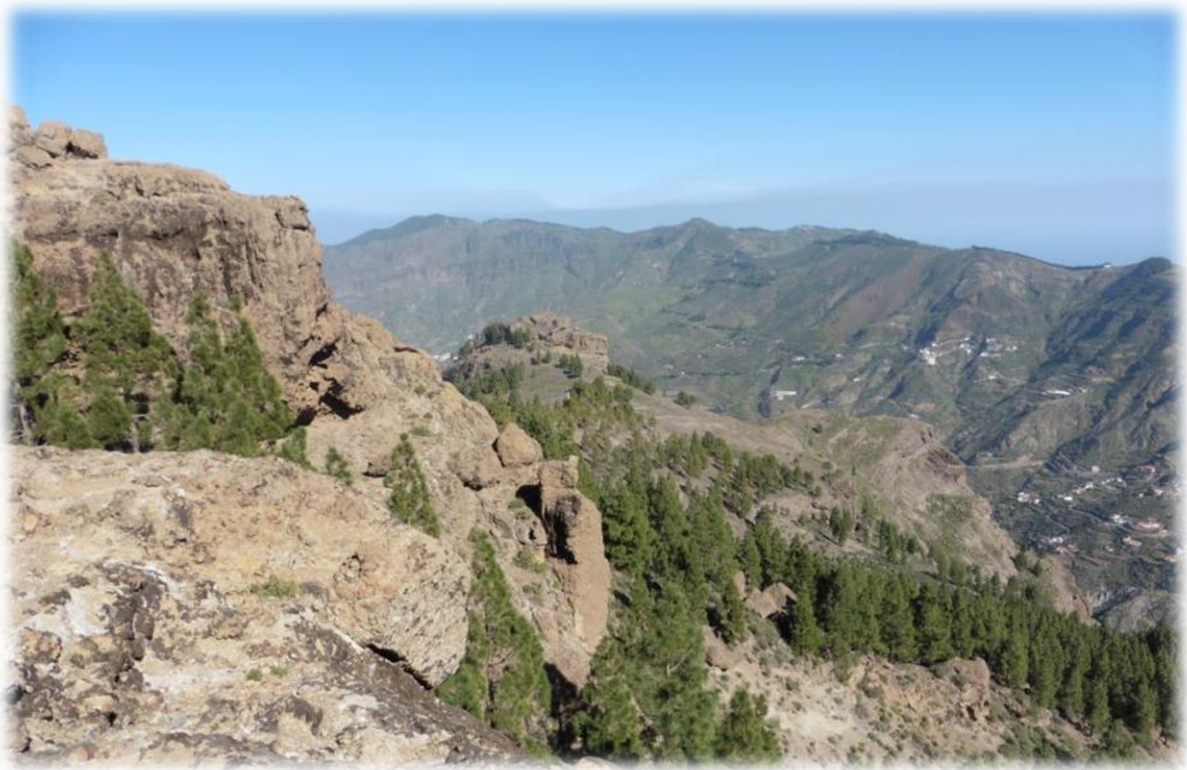
Roque Nublo wordt ook wel eens wolkenrots genoemd omdat dit gesteente, bij bewolking, dikwijls boven de wolken uitsteekt. Rechts is Roque Nublo, links noemt men de kikker.