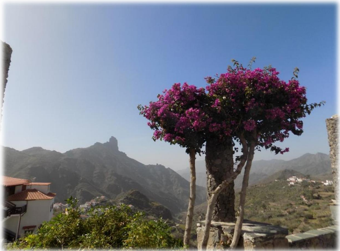
De 1813 m hoge Roque Nublo is het herkenningspunt van Gran Canaria. Van op vele plaatsen is deze rotsblok te zien. Het rotsblok zelf is 65 m hoog.