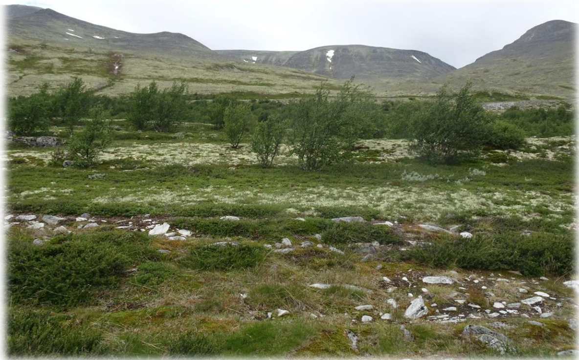
Rondane Nationaal Park is een hoogvlakte gelegen tussen Dombas, Hjerkin, Vinstra, Hundorp en Ringebu. Het grenst aan Dovrefjell Nationaal Park, het enige gebied in