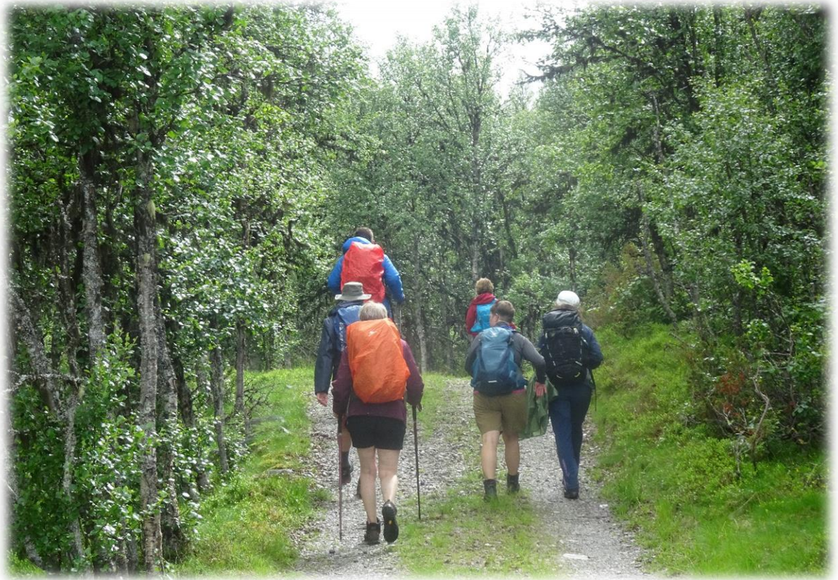
De zure bodem en het ruige klimaat zorgen voor de typische begroeiing van het fjellbos: