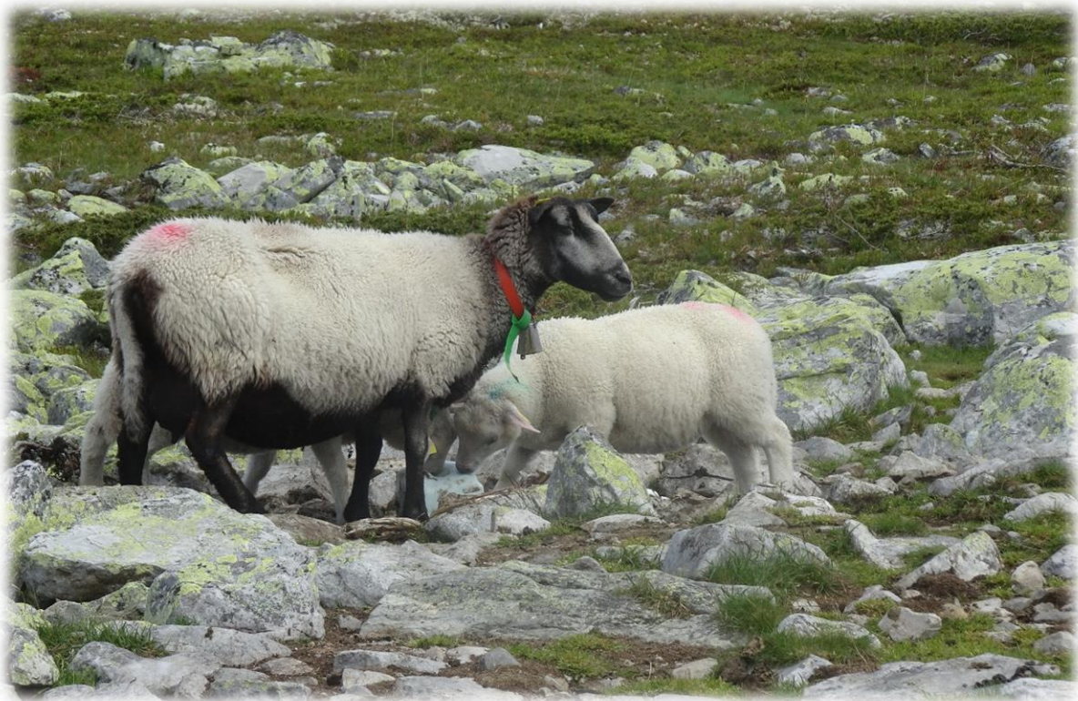
Enkele schapen likken aan een zoutsteen. Een zouttekort bij schapen en geiten uit zich in het likken aan vreemde voorwerpen zoals hout, grond en stenen. Ze eten soms toxische