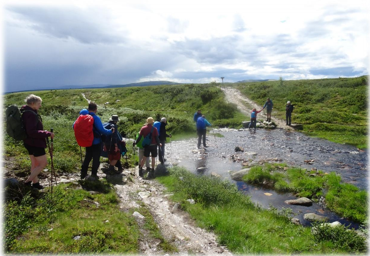
Af en toe dienen we een watertje over te steken. Een beetje avontuur mag er wel bij zijn.